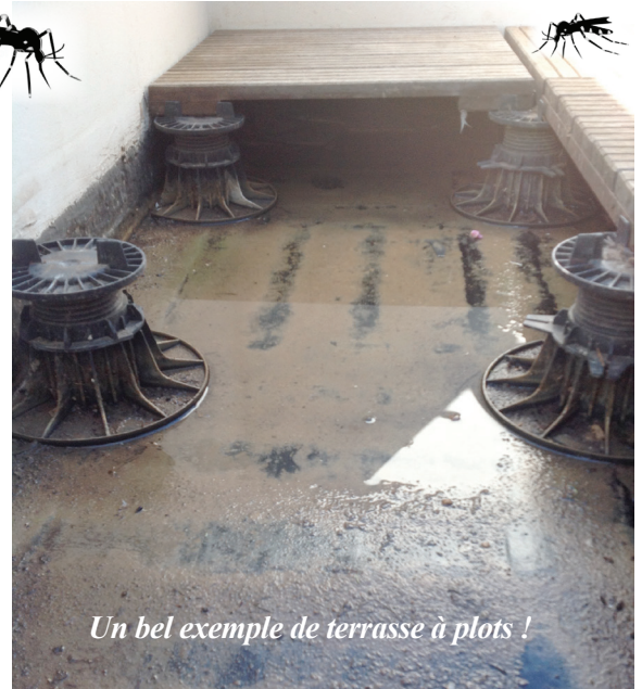
Un bel exemple de terrasse à plots !